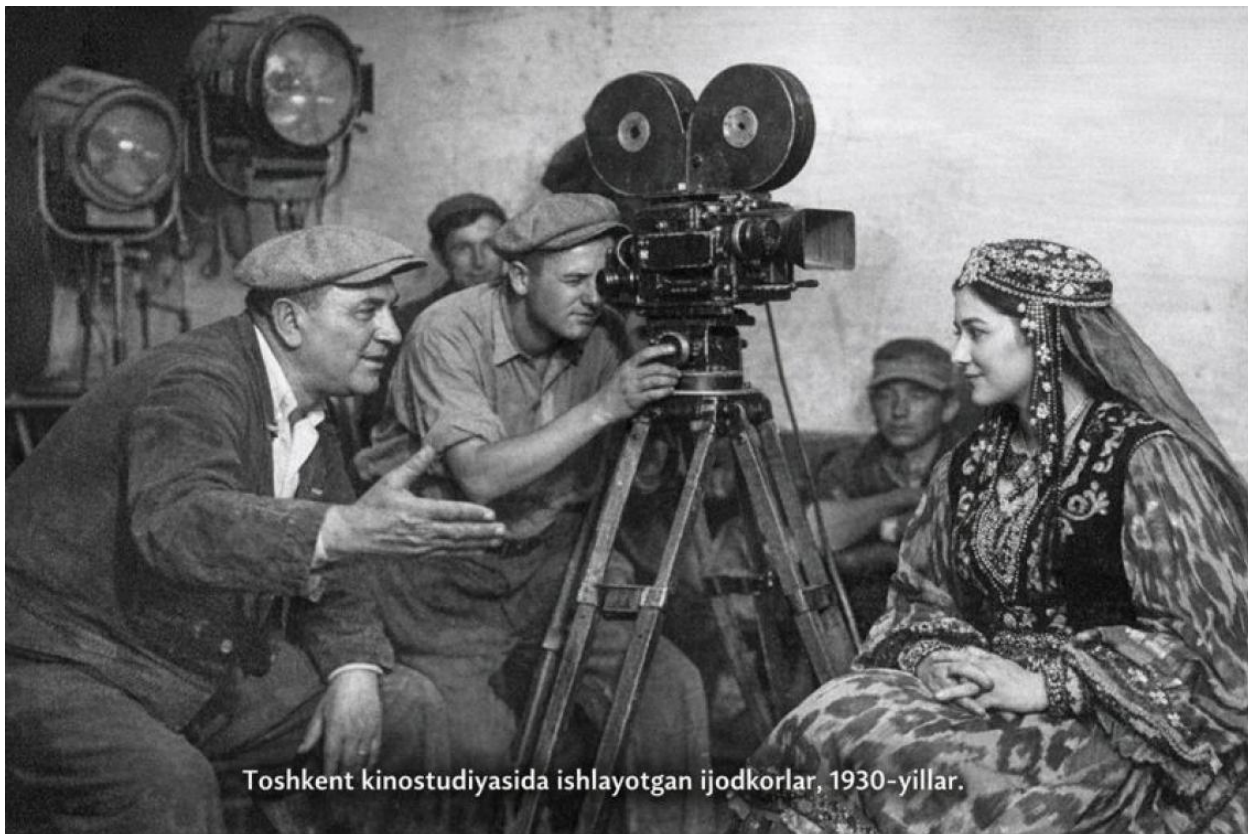
Toshkent kinostudiyasida ishlayotgan ijodkorlar, 1930-yillar.

asosiy rol o'ynaydi. Shu nuqtai nazardan, milliy kino rivojlanishi davlat siyosati, ijodiy muhit va professional kadrlar tayyorlash tizimi bilan chambarchas bog'liq.